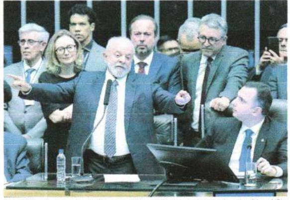
Lula concluiu seu discurso agradecendo a Deus, em uma fala que foi vista como um gesto para as bancadas religiosas da Casa

O mandatário ainda concluiu seu discurso agradecendo a Deus, em uma fala que foi vista como um gesto para as bancadas religiosas da Casa.