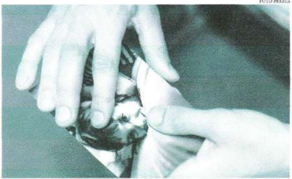
De acordo o Brasileiro de Segurança Pública, ao mesmo tempo que aumentou os casos de pessoas desaparecidas, o número absoluto dos registros de localização também cresceu

O desaparecimento de um familiar ou amigo é um fenômeno bem mais complexo e doloroso, afinal, quando há pessoas desaparecidas sempre existe a esperança de que voltem a qualquer momento. O luto é adiado todos os dias pelas famílias de cearenses desaparecidos. Segundo o levantamento feito pelo Anuário Brasileiro de Segurança Pública, no ano de 2022, o estado registrou uma taxa de 23%, ficando atrás de Pernambuco com 29,6% e Acre com 23,8%, seguido por Alagoas (20%); Rio Grande do Norte (18%); Maranhão (17,2%); Bahia (16,3%); Piauí (14,7%) e Paraíba (13,5%). Em 2021, a taxa foi de 19,6%.