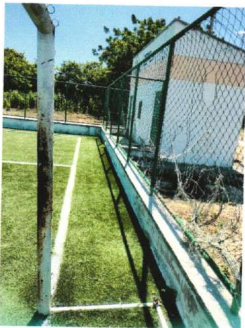
Imagem 5 – Traves da Areninha de futebol Society, na sede do município de Barroquinha-Ce

Será pintada toda a parte dos portões de entrada e das traves de esporte, conforme imagem 5 e 6 a seguir.