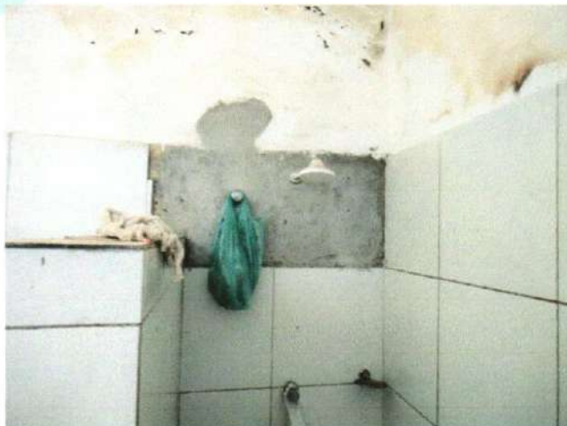
Imagem 11 – Placas de cerâmica soltas nos vestiários da Areninha de futebol Society, na sede do município de Barroquinha-Ce

ESTADO DO CEARÁ PREFEITURA MUNICIPAL DE BARROQUINHA SECRETARIA DA JUVENTUDE, ESPORTE E LAZER