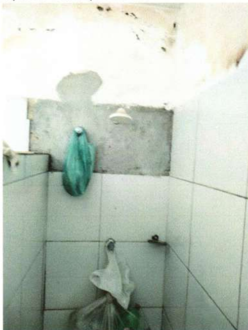
Imagem 10 – Placas de cerâmica soltas nos vestiários da Areninha de futebol Society, na sede do município de Barroquinha-Ce

Em uma parte da parede dos vestiários, deverá ser colocado algumas placas cerâmicas, nas dimensões e cores semelhantes as demais, existentes, conforme imagem 10 e 11 a seguir.