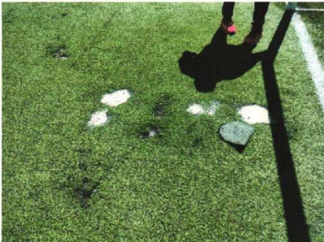
Imagem 8 – Placas de grama arrancadas da Areninha de futebol Society, na sede do município de Barroquinha-Ce