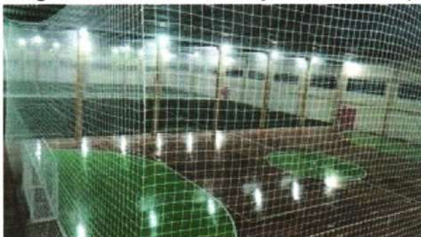
Imagem 4 - Modelo de colocação das redes de proteção.

Será colocada sob o perímetro de todo o alambrado de ambas as quadras, uma proteção de tela de nylon, visando proteger as edificações vizinhas de possíveis danificações ocasionadas por bolas e afins, conforme imagem 4 a seguir.