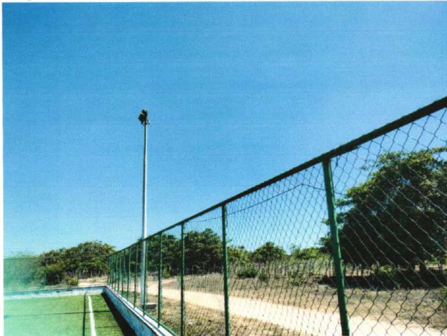
Imagem 3- Areninha de futebol Society, na sede do município de Barroquinha-Ce