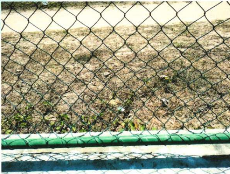
Imagem 2- Areninha de futebol Society, na sede do município de Barroquinha-Ce

ESTADO DO CEARÁ PREFEITURA MUNICIPAL DE BARROQUINHA SECRETARIA DA JUVENTUDE, ESPORTE E LAZER