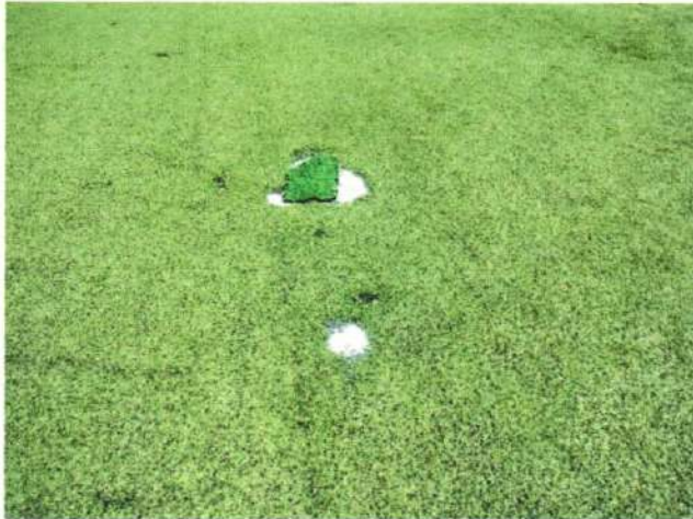
Imagem 7 – Placas de grama arrancadas da Areninha de futebol Society, na sede do município de Barroquinha-Ce

Será removida toda a parte de grama sintética imprópria para uso, bem como recolocadas as placas destas que se encontrarem arrancadas, propiciando o aparecimento de vários buracos por toda a área da Areninha, conforme imagem 7 e 8 a seguir.