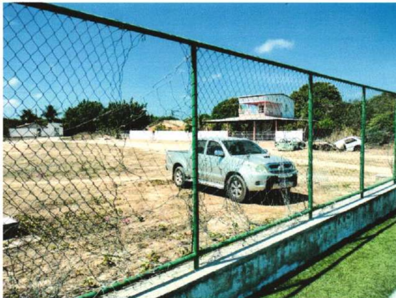
Imagem 1- Areninha de futebol Society, na sede do município de Barroquinha-Ce

Será retirada toda a parte de tela do alambrado, seguindo todo o perímetro da Areninha, para posterior substituição, conforme imagens 1,2 e 3 a seguir.