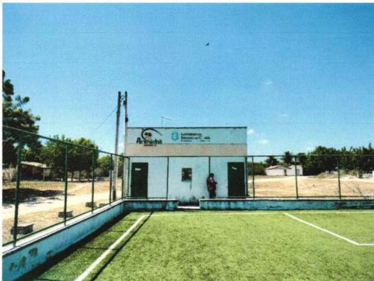
Imagem 9 – Fachada dos vestiários da Areninha de futebol Society, na sede do município de Barroquinha-Ce

Será pintada toda a fachada dos vestiários, com tinta em textura acrílica, na cor estabelecida pela administração, conforme imagem 9 a seguir.