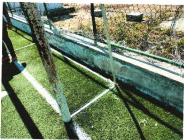
Imagem 6 – Traves da Areninha de futebol Society, na sede do município de Barroquinha-Ce