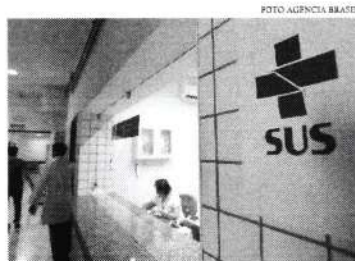
Uma das garantias é a prioridade na rede saúde pública ou privada

FALE COM A GENTE www.ostadoce.com.br e-mail: geral@ostadoce.com.br