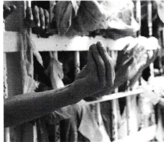
Prazo para sanção ou veto presidencial termina nesta quinta-feira

O projeto de lei que acaba com a saidinha foi aprovado em votação simbólica na Câmara no final de março. Defendida por bolsonaristas, a lei opõe as alas política e progressista do governo. A primeira defende que a medida seja sancionada integralmente por considerar que eventual veto seria derubado pelos parlamentares e ainda azedaria o clima com o Congresso. A segunda pressiona para que Lula não ceda à pressão de conservadores e mantenha coe-