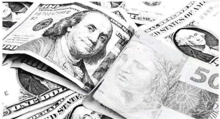
A depreciação do real estava em linha com o movimento de outras divisas globais

No acumulado do mês de junho, o dólar registrou alta de 6,48%. No ano, a moeda americana registra alta de mais de 15% ante o real.