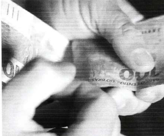
Para a Confederação Nacional da Indústria (CNI), a decisão do Copom não reflete o cenário atual de inflação