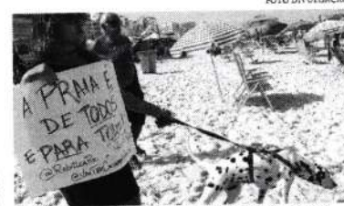
No fim de semana houve protesto contra privatização de praias no Rio de Janeiro

Os terrenos de marinha estão localizados na faixa de 33 metros a partir da linha de maré alta, onde estão localizadas as praias e margens de lagos e rios. Os locais só podem ser ocupados com autorização da Secretaria de Patrimônio da União (SPU), mediante pagamento de uma taxa anual.