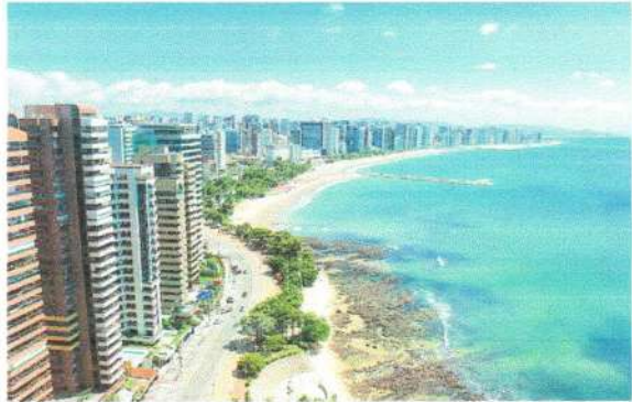
O volume financiado atingiu R$ 82,1 bilhões nos seis primeiros meses do ano

O principal instrumento que permitiu o crescimento do setor imobiliário neste primeiro semestre, porém, foram as LCI's (Letras de Crédito Imobiliário), cuja participação nos financiamentos dobrou em dois anos, saiu de um volume de distribuição de R$ 180 bilhões em junho de 2022 para R$ 363 bilhões até junho deste ano. No mesmo período, o saldo do SBPE (Sistema Brasileiro de Poupança e Emprestimo) na captação de recursos caiu de R$ 779 bilhões para os atuais R$ 763 bilhões.