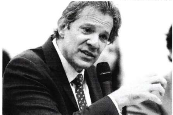
Haddad ressaltou que a inflação está sob controle e em trajetória descendente

O ministro da Fazenda, Fernando Haddad, criticou os movimentos especulativos no mercado financeiro brasileiro nos últimos meses. "Não têm consistência essas projeções [do mercado]. Vamos soltar o relatório fiscal do primeiro semestre em 22 de julho. É o terceiro bimestre do ano que vai trazer números completamente consistentes com as projeções da Secretaria de Política Econômica. Com o trabalho que está sendo entregue, possivelmente, em 2024, vamos ter o melhor resultado fiscal dos últimos dez anos", declarou o ministro após a reunião do Conselho Monetário Nacional (CMN). Haddad ressaltou que a inflação está sob controle e em trajetória descendente, como mostrou o Índice Nacional de Preços ao Consumidor Amplo-15 (IPCA-15), divulgado hoje. Haddad ressaltou que a inflação oficial ficou abaixo de 4,75% no ano passado e ficará abaixo de 4,5% neste ano. "Se estamos tendo notícia de que a inflação é declinante no Brasil. Não estou vendo sinal de apreensão em relação ao compromisso do Banco Central e do governo com o atingimento das metas. Lembrando que durante o seu mandato, o presidente Lula cumpriu, se eu não me engano todos os anos, mas quase todos os anos as metas estabelecidas nos seus oito anos, não está sendo diferente nesses dois primeiros anos