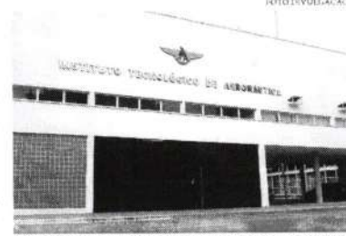
O Ceará se prepara para receber a primeira sede do instituto fora de São Paulo

O Ceará tornou-se um celeiro para gênios das exatas de todo o país. No estado que historicamente lidera proporcionalmente as aprovações em um dos vestibulares mais difíceis do país — o ITA (Instituto Tecnológico de Aeronáutica) —, escolas particulares garimpam os melhores alunos, oferecem de bolsas a alojamentos, incentivam a competição em olimpíadas e formam turmas especializadas para o exame. No último vestibular, o Ceará foi responsável por um terço das aprovações no ITA, ocupando 56 vagas. Cada vez mais estudantes e famílias se mudam para o Ceará em busca da expertise. Embora a fórmula hoje seja replicada em outras escolas, são dois grandes colégios particulares de Fortaleza os principais responsáveis pelas aprovações: Farias Brito e Ari de Sá. Em ambos, o número de alunos de fora já supera o de cearenses e há uma verdadeira