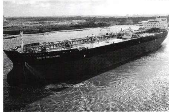
A compra faz parte do programa de renovação e ampliação da frota do sistema Petrobras

A Transpetro, subsidiária da Petrobras, anunciou nesta segunda-feira (8) a licitação internacional para aquisição de navio da classe Handy, de 15 a 18 mil toneladas de porte bruto, para transporte de produtos do petróleo, como a gasolina. A previsão para se conhecer o estaleiro vencedor será dezembro na assinatura do contrato. A compra faz parte do programa de renovação e ampliação da frota do sistema Petrobras e pode gerar novas oportunidades para a indústria naval brasileira. Fazem parte do programa 16 navios de cabotagem já previstos no Plano Estratégico 2024-2028. Com o objetivo de atender as demandas de transporte de produtos, as embarcações contemplam soluções que garantem maior eficiência energética e menor emissão de gases de efeito estufa. O edital está publicado no portal Petronet e tem o formato de licitação internacional aberta, que permite a participação de todos os estaleiros que atendam aos critérios técnicos e econômicos previstos no certame. As empresas interessadas têm o prazo de 90 dias para apresentar suas propostas. De acordo com o cronograma da concorrência, o lançamento do primeiro navio Handy é estimado para o primeiro semestre de 2026. Os demais navios serão entregues sucessivamente a cada seis meses, até meados