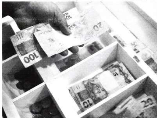
Desde o início de 2024, o mínimo é de R$ 1.412. Os ajustes são feitos com base na inflação e PIB

Desde o início de 2024, o salário mínimo é de R$ 1.412, conforme um decreto assinado por Lula, que implementou a nova lei de valorização do salário mínimo aprovada no ano passado. A previsão para 2025 poderá ser ajustada conforme alterações nas estimativas de inflação e revisões do PIB de 2023 pelo IBGE, com o valor definitivo a ser definido após a publicação do decreto presidencial.