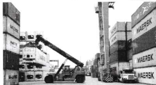
O volume das exportações alcançou um novo recorde em julho, com US$ 30,9 bi

O volume das exportações brasileiras, no entanto, alcançou um novo recorde em julho, totalizando o movimento de US$ 30,9 bilhões. Esse desempenho foi impulsionado principalmente por produtos agrícolas como soja e café, e itens da indústria extrativa, como minério de ferro, e itens da indústria de transformação, incluindo aço, carne bovina e açúcar. Por outro lado, da mesma forma, as importações também aumentaram em relação ao ano anterior, com um crescimento notável nos bens de capital, resultando em uma corrente comercial de aproximadamente US$ 23,3 bilhões. No acumulado de 2024 até