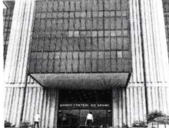
A atual previsão do mercado é de que a Selic deve continuar no patamar de 10,50%

A atual previsão do mercado é de que a Selic deve continuar no patamar de 10,50% ao ano na próxima