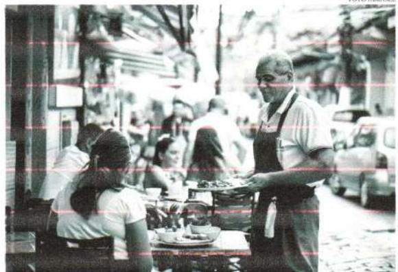
O setor de serviços, o maior empregador do Brasil, contribuiu com um peso de quase 70% no indicador

O consumo das famílias e do governo avançou 1,3% em comparação ao primeiro trimestre. No caso do consumo governamental, a proximidade das eleições municipais contribuiu para o aumento dos gastos públicos. Por outro lado, o setor externo apresentou uma influência negativa no desempenho econômico, com as importações crescendo 7,6%, superando o aumento de 1,4% nas exportações. A expectativa do mercado financeiro para o crescimento do PIB em 2024 é de 2,46%, conforme a última edição do boletim Focus,