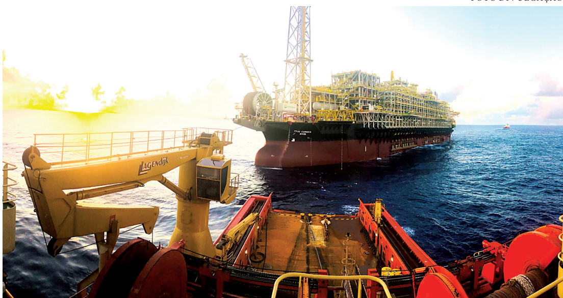
A Petrobras também prevê alta em suas exportações

Em 2024, pela primeira vez na história, o Brasil exportou mais da metade de sua produção de petróleo, consolidando-se como um país exportador da commodity e tornando-se alternativa ao suprimento europeu após o início de sanções à venda pela Rússia devido à Guerra da Ucrânia.