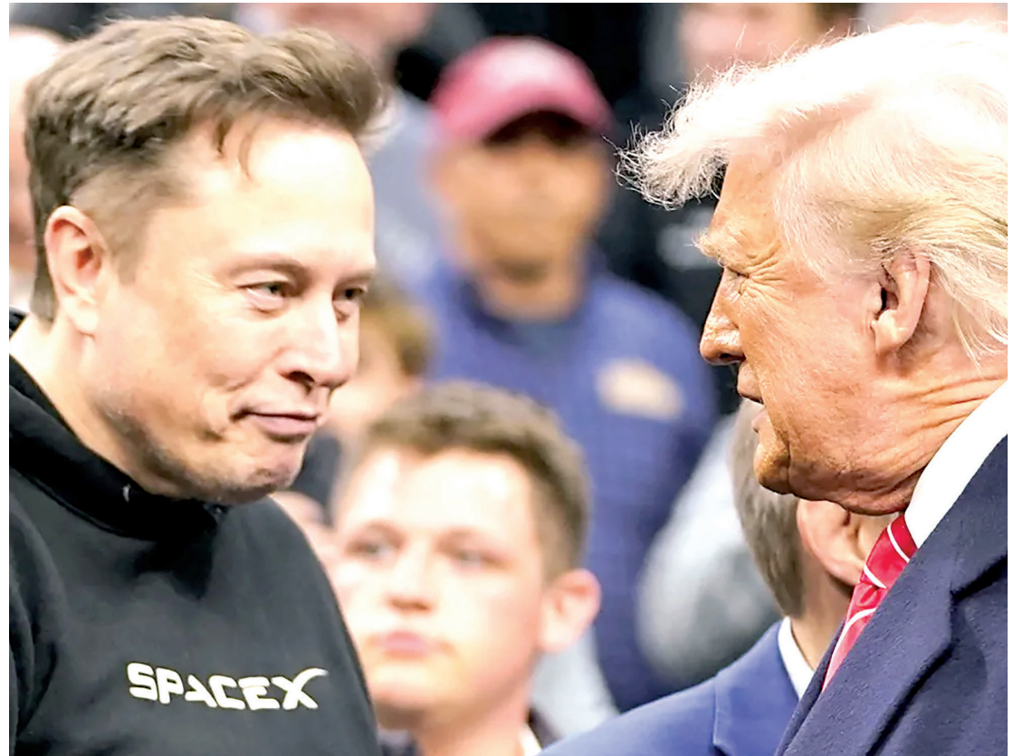
Musk se afastou do governo Trump devido à “repercussão negativa” nos negócios

Musk, que até então se abstinha de atacar Trump diretamente, rebateu nas redes sociais. Em uma sequência de postagens críticas ao governo no X (ex-Twitter),