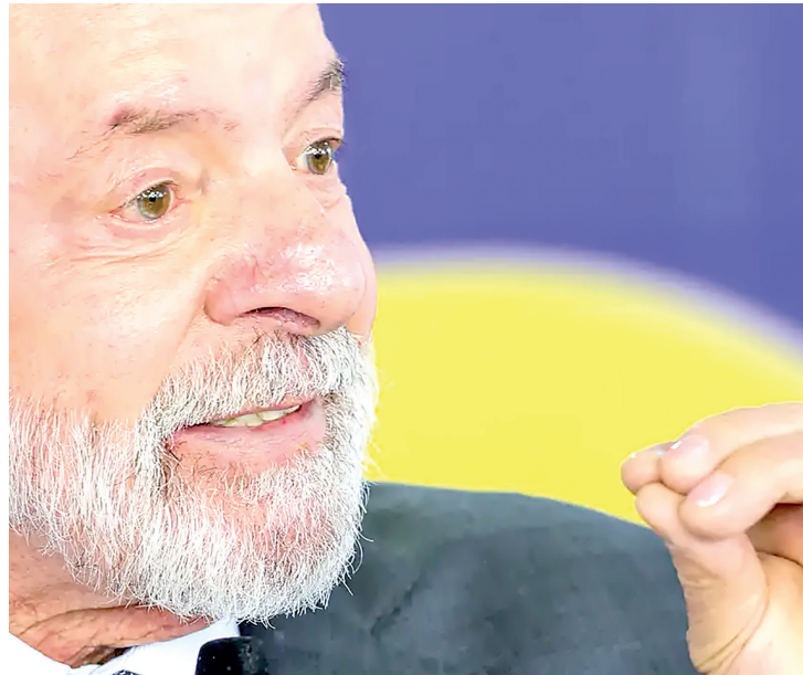
Lula defendeu medidas concretas para enfrentar a crise ambiental marinha

Segundo Lula, enquanto a AOD caiu 7% em 2024, os gastos militares mundiais cresceram 9,4% no mesmo período. “Isso mostra que não falta dinheiro. O que falta é disposição e compromisso político para financiar o que realmente importa”, afirmou. A AOD, definida pela Organização para a Cooperação e Desenvolvimento Econômico (OCDE), é um