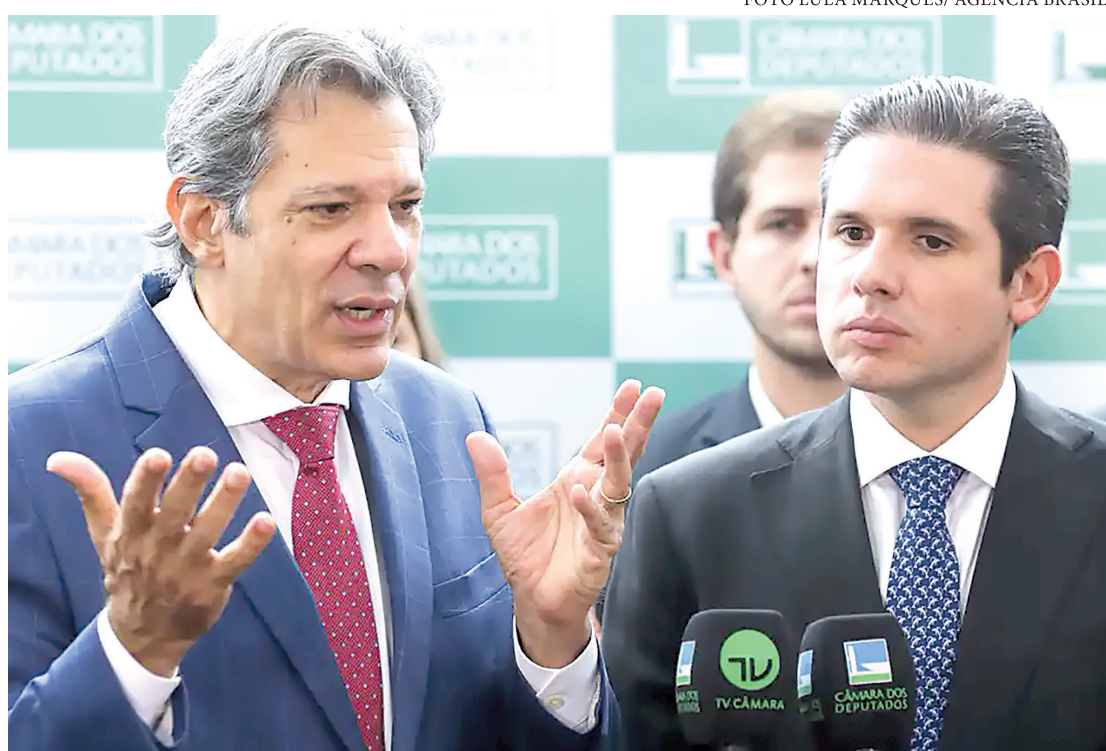
Entre as medidas em análise estão o aumento da alíquota sobre as chamadas bets

Entre as medidas em análise estão o aumento da alíquota sobre as chamadas