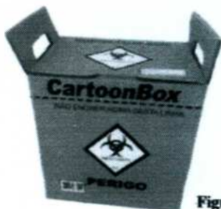
Figura 3: Caixa Decartex para descarte de Res duo de Servi o de Sa de Infectante