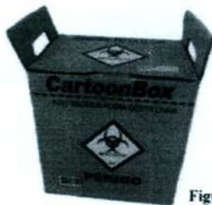
Figura 3: Caixa Decartex para descarte de Resíduo de Serviço de Saúde Infectante