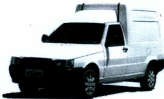
Figura 1- Ilustração do veículo para a realização de coletas

No percurso de deslocamento para a descarga no destino final, todas as tampas de abertura do veículo coletor deverão estar completamente fechadas.