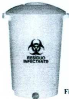
Figura 4: Tambor para descarte de Resíduo de Serviço de Saúde Infectante