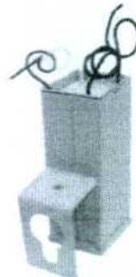
Imagens Ilustrativas de luminária aberta e reator