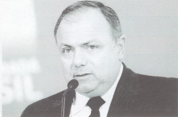
Pazzuello será questionado sobre a atuação do governo durante o colapso em Manaus

O mais provável é que a comissão trabalhe de ma-