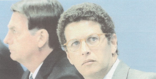
Jair Bolsonaro e Ricardo Salles estão no olho do furacão do mundo na questão ambiental amazônica

De acordo com pessoas que acompanham os preparativos, Bolsonaro deve repetir em seu discurso, de forma mais concisa, a mensagem antecipada em carta enviada a Biden no dia 14 de abril. No documento, o líder brasileiro prometeu acabar com o desmatamento ilegal até 2030. "Reitero o compromisso do Brasil e do meu governo com os esforços internacionais de proteção do meio ambiente, combate à mudança do clima e promoção do desenvolvimento sustentável. Teremos enorme satisfação em trabalhar com V. Excelência em torno desses objetivos comuns", escreveu Bolsonaro ao democrata na ocasião, distanciando-se da imagem do presidente que,