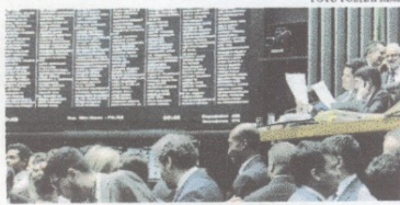
Gastos têm crescido nos últimos anos e alcançaram R$ 14,9 mi em 2020