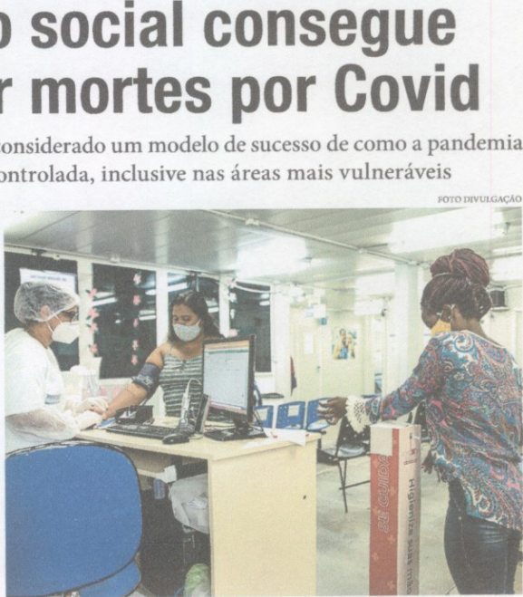
Centro de triagem de informações sobre a doença: ajuda para evitar a proliferação da covid-19

FALE COM A GENTE www.oestadoce.com.br e-mail: geral@oestadoce.com.br