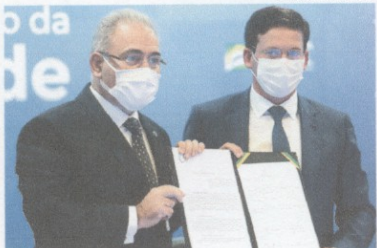
Os ministros da Saúde e da Cidadania assinaram uma parceria, ontem