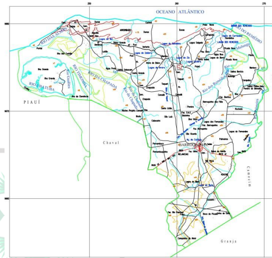
IMAGEM 2: Mapa Geral de Barroquinha-CE

ESTADO DO CEARÁ PREFEITURA MUNICIPAL DE BARROQUINHA SECRETARIA DA INFRAESTRUTURA E SERVIÇOS PÚBLICOS