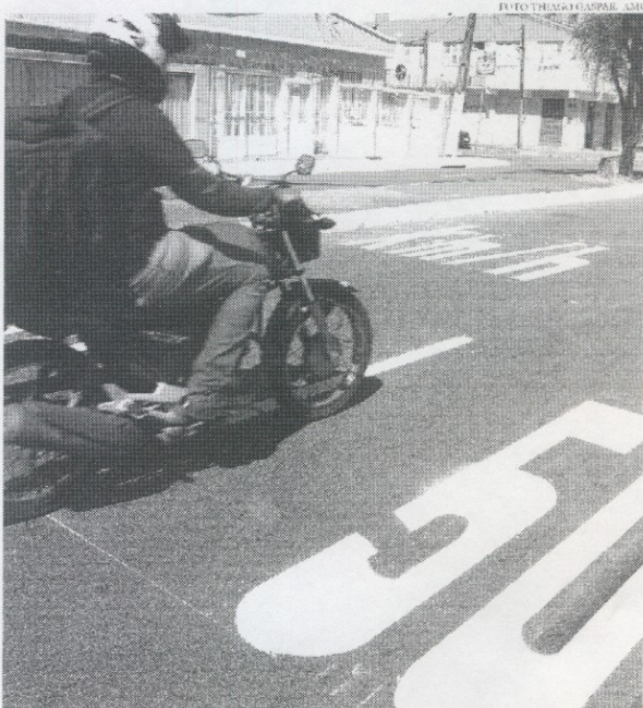
Av. Jovita Feitosa foi uma das vias da Capital que passaram por redução de velocidade, de 60 Km/h para 50 Km/h

Outro fator sinalizado pelo órgão é que essa diminuição ocorre em meio à retomada do fluxo de veículos na cidade, tendo em vista a flexibilização das medidas sanitárias para o