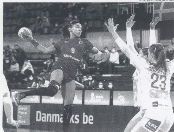
A seleção na primeira fase tinha tido uma das três melhores campanhas da história da competição

Neste início de novo ciclo, o time deixou de contar