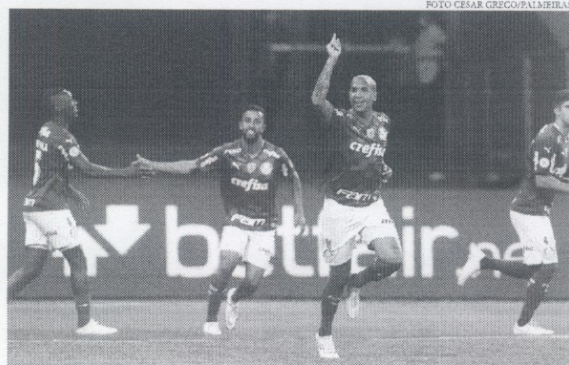
Palmeiras terá a sua primeira partida após a derrota na final do mundial, na noite de hoje contra a Ferroviária

No entanto, com a janela europeia fechada, não restam muitas opções para ne-