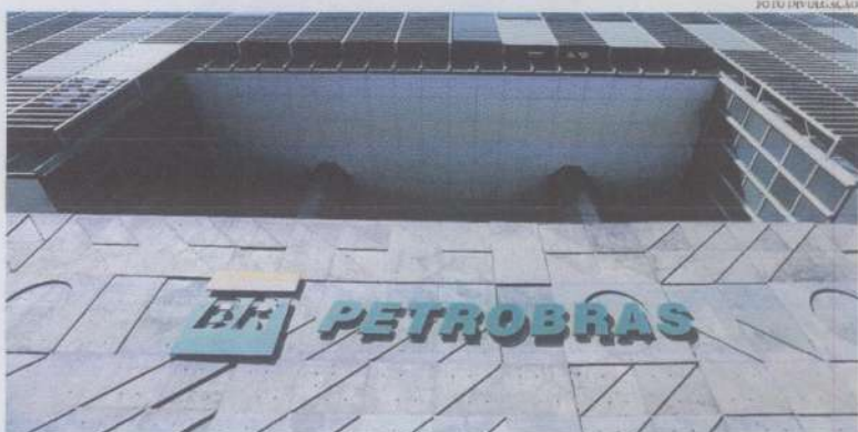
Câmara dos Deputados aprovou um projeto que muda a Lei das Estatais para reduzir quarentena de indicados para cargos

Mercado e petroleiras veem com preocupação a aprovação de mudanças na Lei das Estatais na Câmara dos Deputados, ações da Petrobras caem