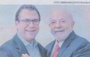
Lula convidou Marinho para assumir o cargo e ele já aceitou o convite

TEMPO NO BRASIL (Máxima) São Paulo 24°C - Brasília 26°C - Rio 22°C FALE COM A GENTE: www.oestado.com.br e-mail: gereis@oestadoce.com.br