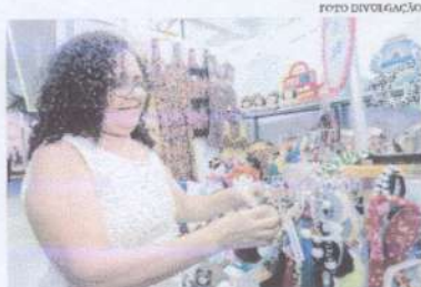
Programação acontece nesta quarta e quinta-feira (28 e 29/12).

A SDE contará com 24 estandes, sendo 20 do Programa Nossas Guerreiras, um do Projeto Costurando o Futuro