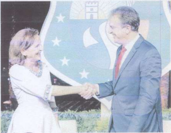
Camilo Santana anunciou a atual governadora do Ceará, Izolda Cela, como secretária executiva do MEC

Durante a conversa, o cearense revelou que tem conversado com o futuro ministro da Fazenda, Fernando Haddad, que já esteve à frente do Ministério da Educação (MEC) durante a primeira gestão de Luís Inácio Lula da Silva (PT), sobre a alteração dos valores para garantir a segurança alimentar nas escolas brasileiras. O valor, no entanto, segue sen-