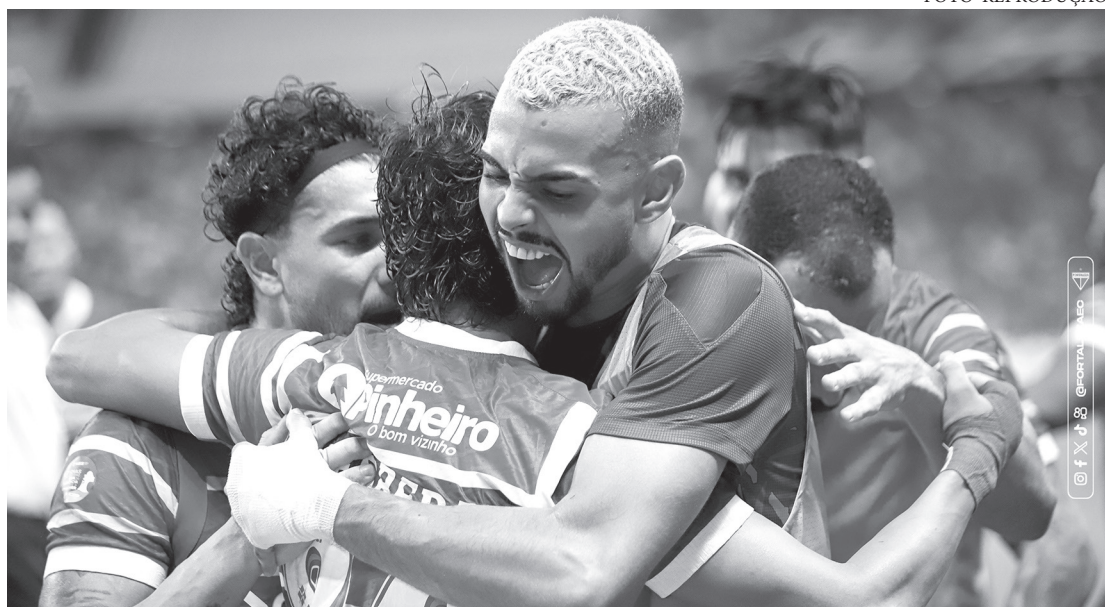
Os cearenses balançaram as redes com Pochettino, logo aos sete minutos do primeiro tempo, e com Herrera, aos 13 da etapa final

O primeiro tempo teve ritmo alto no Castelão. Embora o Corinthians tenha sido superior na construção das