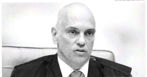
Alexandre de Moraes é cobrado pelos deputados distritais, que questionam sua postura