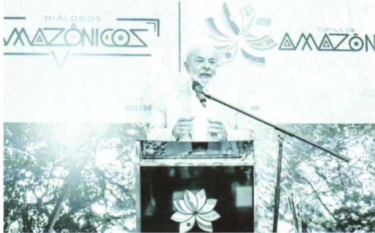
A "Declaração de Belém", elogiada e criticada por especialistas, foi o principal documento da reunião

A Cúpula da Amazônia, que reuniu representantes de 15 países diferentes, encerrou-se nesta quarta-feira, 09, em Belém, no Pará. No último dia de evento, o presidente Luiz Inácio Lula da Silva cobrou das nações mais desenvolvidas que investissem na preservação da floresta amazônica. "Nós vamos para COP28 para dizer ao mundo rico que se quiserem preservar efetivamente o que temos de floresta é preciso colocar dinheiro", pontuou. Para Lula, o investimento não é restrito à "copa das árvores", mas também deve ser destinado para a população que vive na região. "O exemplo que temos no Brasil é que parte das terras mais preservadas nesse país é das terras indígenas, já temos os fiscais naturais para cuidar da nossa floresta, é só respeitá-los", declarou.