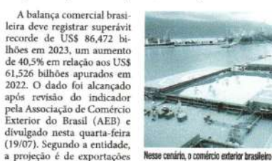
Nesse cenário, o comércio exterior brasileiro contribuirá de forma positiva no cálculo do PIB

Produtos como a soja em grãos deverão manter a liderança nas exportações do país, ultrapassando o US$ 50 bilhões