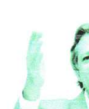
Ministro Haddad disse que a Fazenda está fazendo a sua parte com medidas que aumentam arrecadação

Projeção. Os economistas ouvidos pelo Banco Central mantiveram as previsões dos principais indicadores econômicos no balanço. A expectativa para a inflação deste ano permaneceu em 3,81%, após ter sido de 3,82% em janeiro da semana passada. A perspectiva para os próximos três anos também seguiu a mesma: 3,5% para 2025, 2026 e 2027.