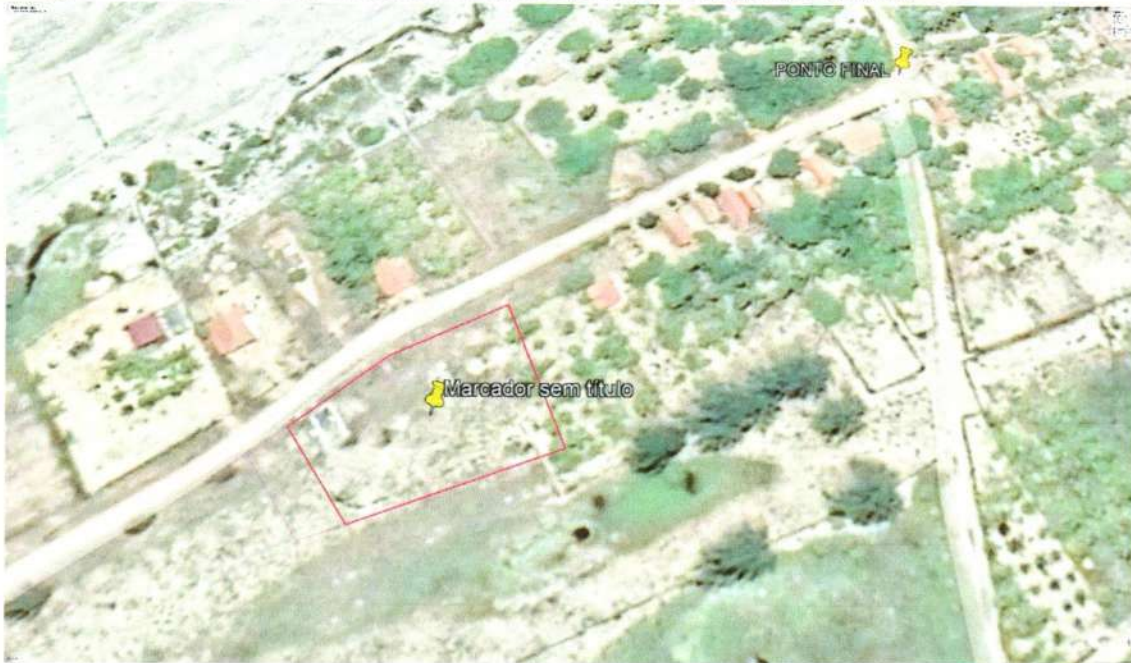
Imagem 1- Local que será construído o cemitério da Localidade de Curimãs.