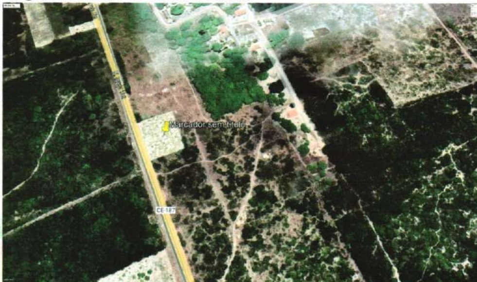
Imagem 2- Cemitério do Distrito de Araras.