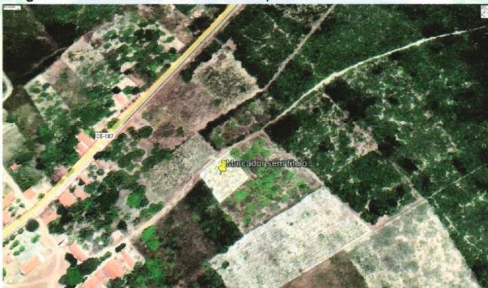
Imagem 3- Cemitério da Localidade de Chapada