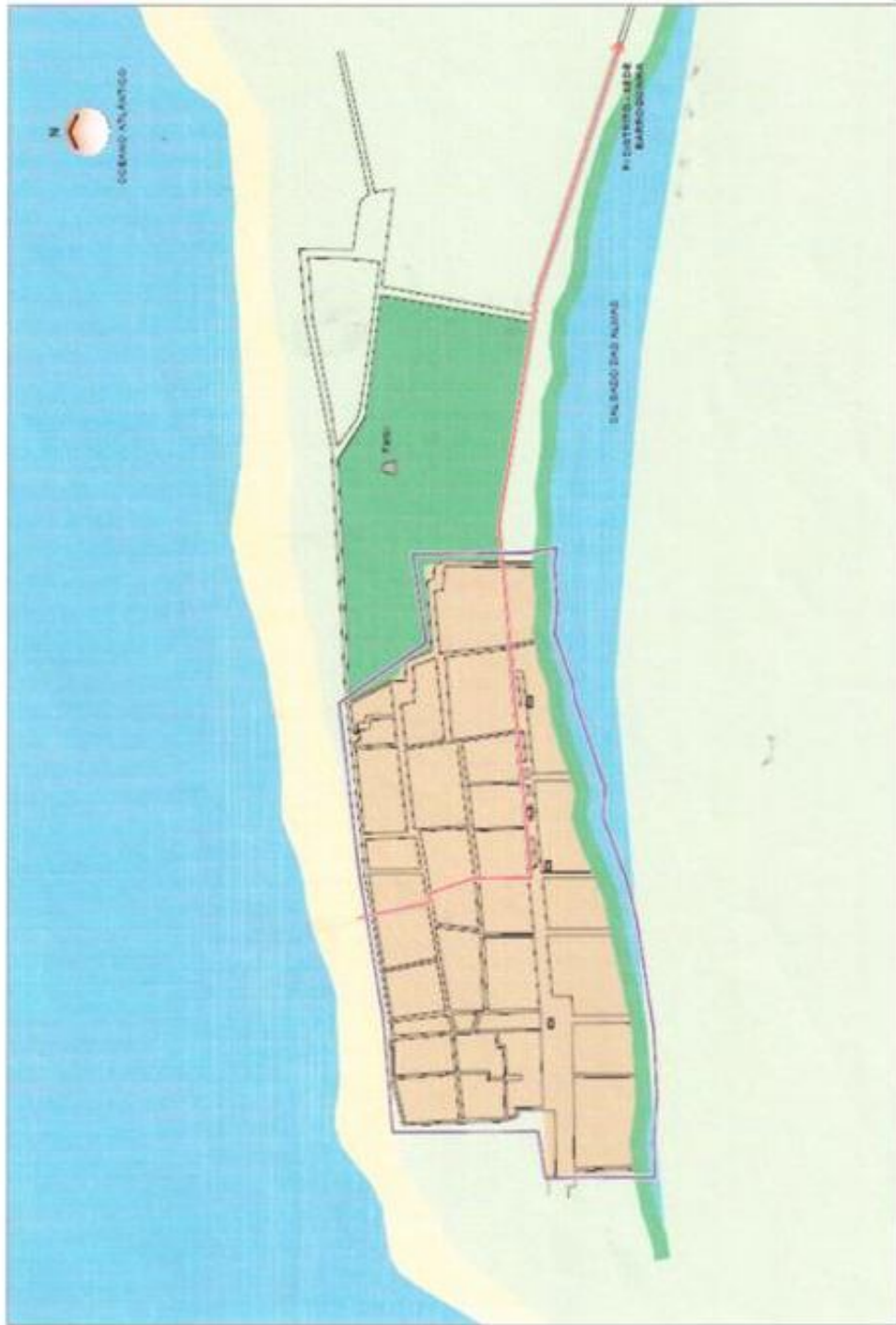
ANEXO IV - CÓDIGO AMBIENTAL ZONAMIENTO AMBIENTAL - ÁREA 4 - DISTRITO DE BITUPITA