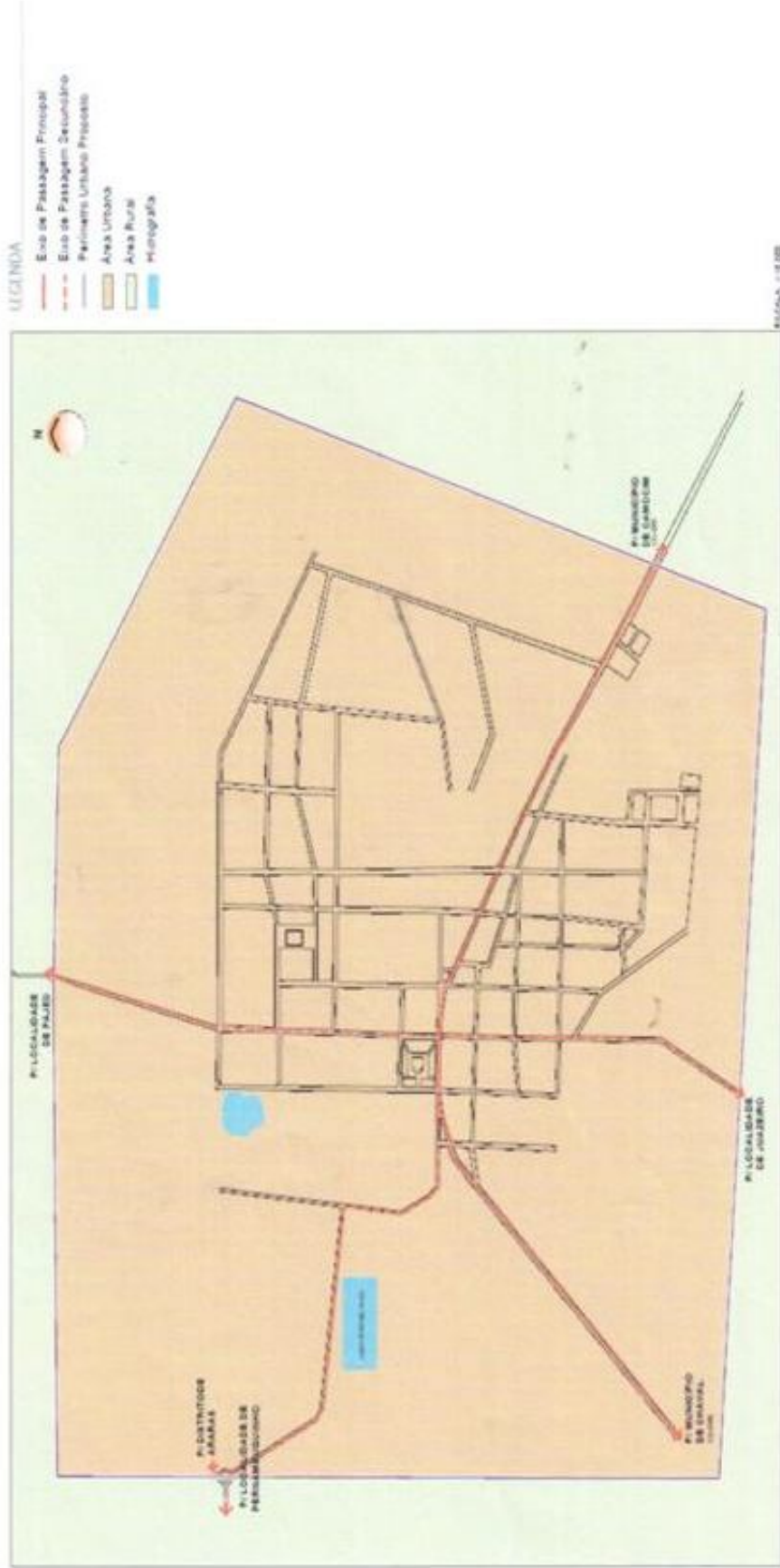
ANEXO B - LEI DO PERÍMETRO URBANO PLANTA OFICIAL DE ORGANIZAÇÃO TERRITORIAL - ÁREA 2 - SEDE MUNICIPAL